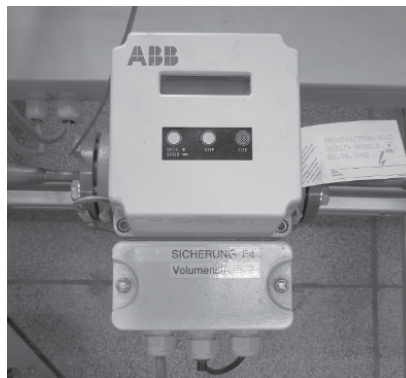
Abb. 5.1.5: ABB -Durchflussmesser [3] im eingebauten Zustand

Abb. 5.1.5 zeigt einen derartigen Durchflussmesser im eingebauten Zustand. Innerhalb des Gerätes wird senkrecht zur Flussrichtung des Fluids ein Magnetfeld erzeugt, welches die im Fluid (im vorliegenden Falle Wasser) vorhandenen Ladungsträger ablenkt. Wiederum senkrecht zum Magnetfeld sind Messelektroden angeordnet, in denen durch die Ablenkung der Ladungsträger (Ionen) eine Spannung induziert wird. Die Höhe der Spannung ist dabei proportional der Strömungsgeschwindigkeit. Wichtig ist bei der Installation derartiger Durchflussmesser, dass vor wie auch nach dem Gerät eine „Beruhigungsstrecke“ des Fluids vorhanden ist. Diese soll verhindern, dass mögliche Turbulenzen durch Rohrbögen bzw. andere Einbauten die Messung negativ beeinflussen. Im vorliegenden Fall wurde die Beruhigungsstrecke über eine Reduzierung und ein gerades Rohrstück gewährleistet. Abb. 5.1.5 zeigt dies im Bereich der Nachlaufstrecke. Die Messgenauigkeit des verwendeten Durchflussmessers wird vom Hersteller mit einem Wert von 0,5 % bezogen auf den Messwert angegeben.