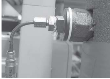
Abb. 5.1.4: Pt100 Sensor im eingebauten Zustand