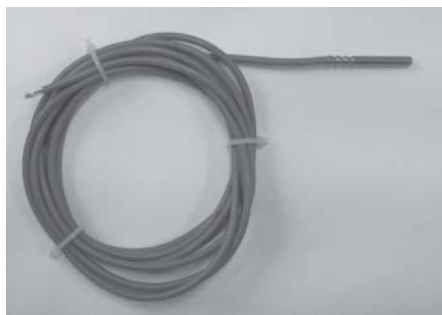
Abb. 5.1.3: Pt100 Sensor [162]

Die genannten Sensoren nutzen die elektrische Widerstandsänderung bei verschiedenen Temperaturen aus. Als Sensor-Material wird Platin verwendet (Messgenauigkeit entsprechend Abs. 5.1.2.5).